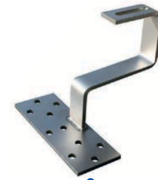
Supporto per fissaggio su tetti con tegole

CONFIGURAZIONE: le diverse opzioni di configurazioni flessibili garantiscono sempre una soluzione per ogni tipo di tetto